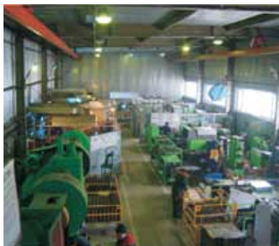
• Производственный цех АО «Келет»

Основные направления его работы: поставка оборудования для водоснабжения, вентиляции и отопления - это те три кита, на которых предприятие крепко и уверенно стоит без малого 20 лет.